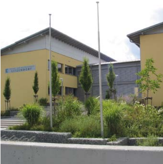
Schulen erhalten und Turnhalle bauen - zentrale Forderungen der Ellertaler SPD