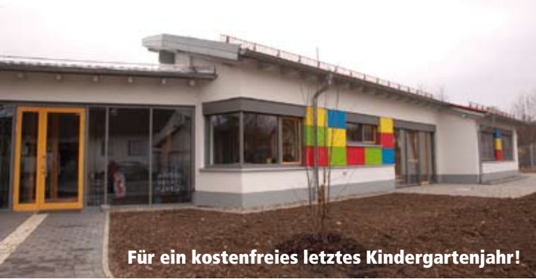
Für ein kostenfreies letztes Kindergartenjahr!

Wir wollen den Fremdenverkehr durch verstärkte Zusammenarbeit mit den Nachbargemeinden Memmelsdorf und Strullendorf fortentwickeln, unter anderem mit einem zentralen Fremdenverkehrsbüro in Litzendorf.