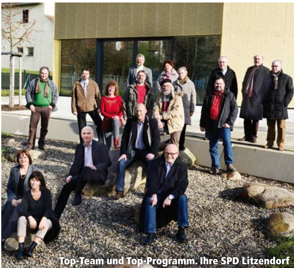
Top-Team und Top-Programm. Ihre SPD Litzendorf

Wir wollen die Breitbandversorgung für die ganze Gemeinde forcieren. „Schnelles Internet für alle“ - das muss eine Selbstverständlichkeit sein.